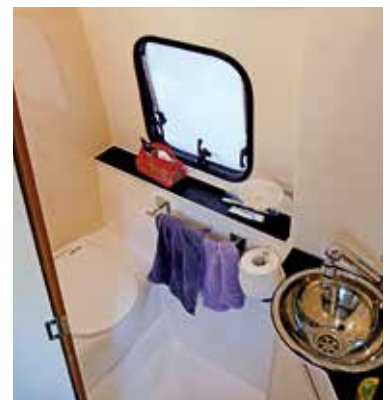
Praktisch: das geräumige Bad und viele Möglichkeiten, etwas zu verstauen.

Geräumig geht es im Längsbad des Campers (116 mal 65 Zentimeter Grundfläche) zu. Es ist nahezu vollständig mit Kunststoffwänden ausgekleidet und fungiert gleichzeitig als bequeme Duschkabine. Ein