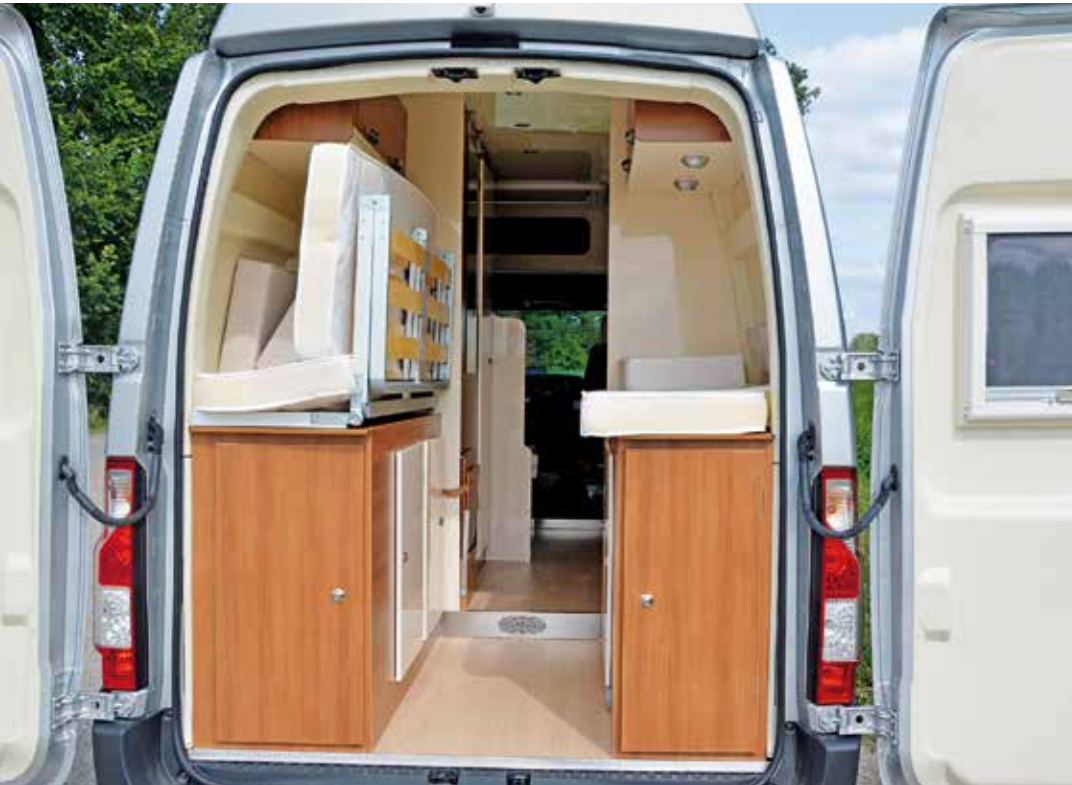
Gut gemacht: Der Mittelteil des Bettes lässt sich wegklappen. Dadurch vergrößert sich das Ladevolumen der durchladbaren Heckgarage, die dann sogar Surfbretter und auch Fahrräder aufnehmen kann.